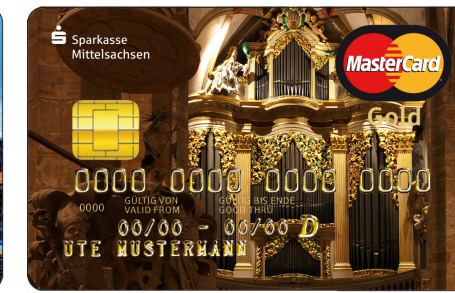
Eine Auswahl unserer Motive für die Gold-Kreditkarten